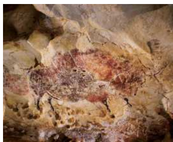
(復元)褐色のバイソン

今から2万年ほど前、フランス南 西部のラスコー洞窟に壮大な壁 画が描かれました。本展では謎に 包まれたラスコー洞窟の全貌を紹 介するとともに、1ミリメートル以下 の精度で再現した実物大の洞窟 壁画展示によって、研究者ですら 入ることができない洞窟内部の世 界を体験することができます。