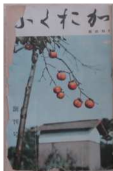
県広報紙『ふくおか』 (昭和26年度)

県や市町村の地域性豊かな広報紙を一 堂に展示し、貴重な創刊号や全国広報コ ンクールの受賞広報紙などを紹介します。 また、広報紙ができるまでの編集作業や、 県広報紙「ふくおか」(「グラフふくおか」の 前身)の紙面から見えてくる社会の移り変 わりを振り返ります。